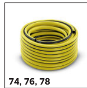
74, 76, 78