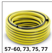
57-60, 73, 75, 77